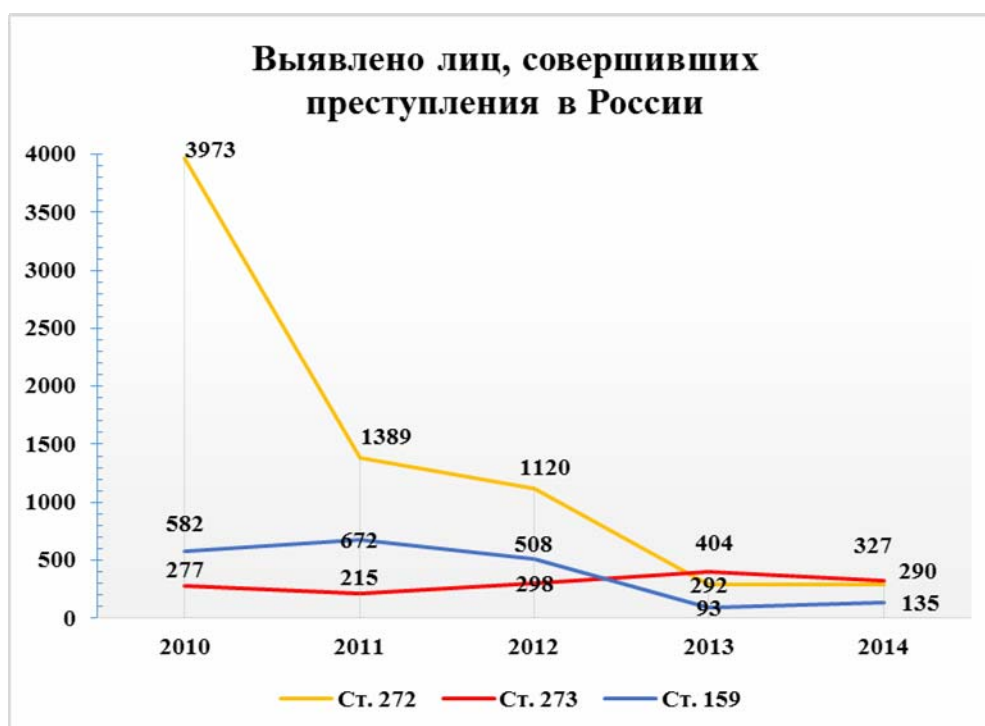
Рис. 2. Динамика раскрываемости киберпреступлений